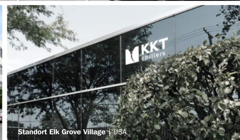
Standort Elk Grove Village | USA