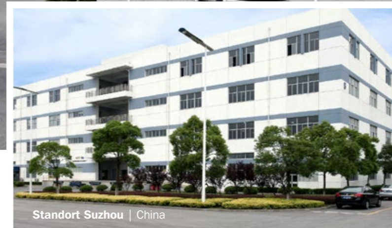
Standort Suzhou | China